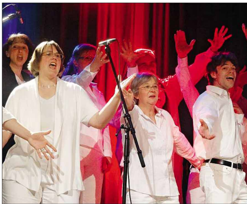
Die Vindonissa Singers voll im Schwung