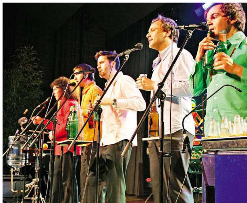
GlasBlasSing in Aktion